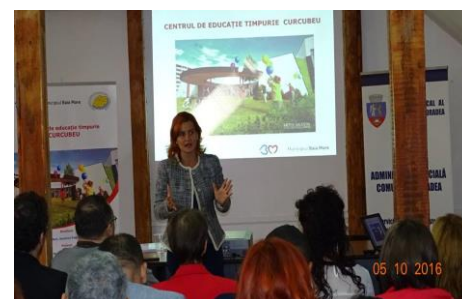
Administrația Socială Comunitară Oradea

Prezentările susținute în cadrul evenimentului sunt disponibile AICI .